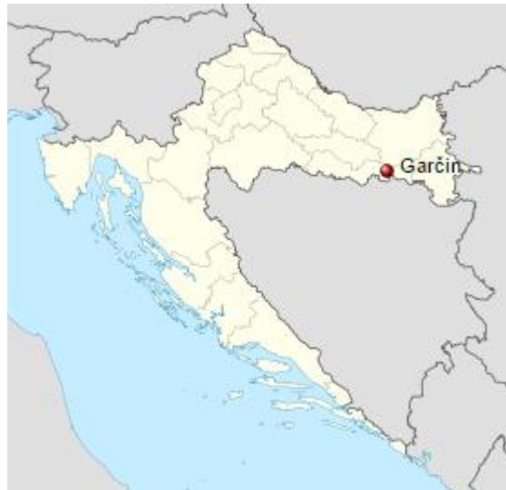
Slika 1. Geografski smještaj Općine Garčin

Klimatološke karakteristike prostora općine Garčin dio su klimatskih karakteristika širega prostora istočne Hrvatske. Cijelo područje, kao i širi prostor, ima sve odlike umjereno kontinentalne klime, koju karakteriziraju česte i intenzivne promjene vremena.